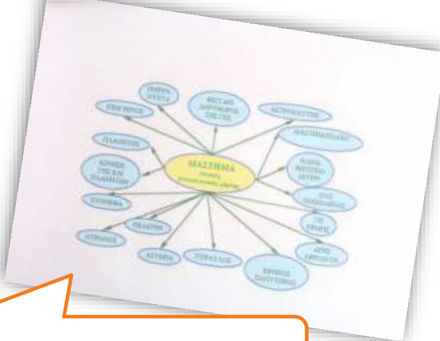
Τελικός εννοιολογικός χάρτης